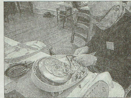
Un vendredi après-midi sur deux, ils sont une dizaine à prendre possession des locaux de l'ancienne mairie avec pour objectif de redonner vie à des objets du quotidien.